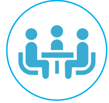
ご来社での 打合せ

状況に応じて営業担当または、サポートチームが対応させていただきます。 遠方のお客様はオンラインでお打ち合わせ可能です。