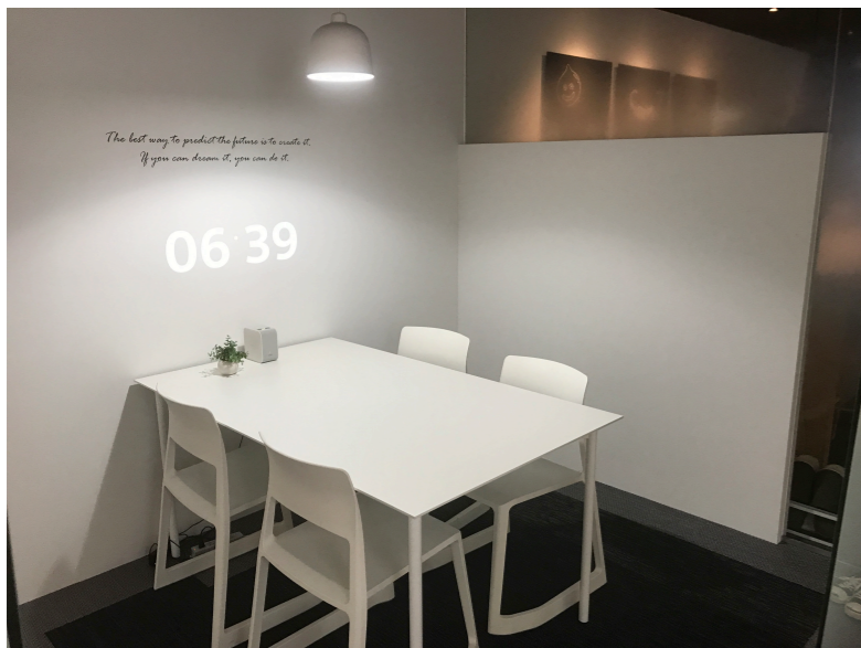
ミーティングスペース